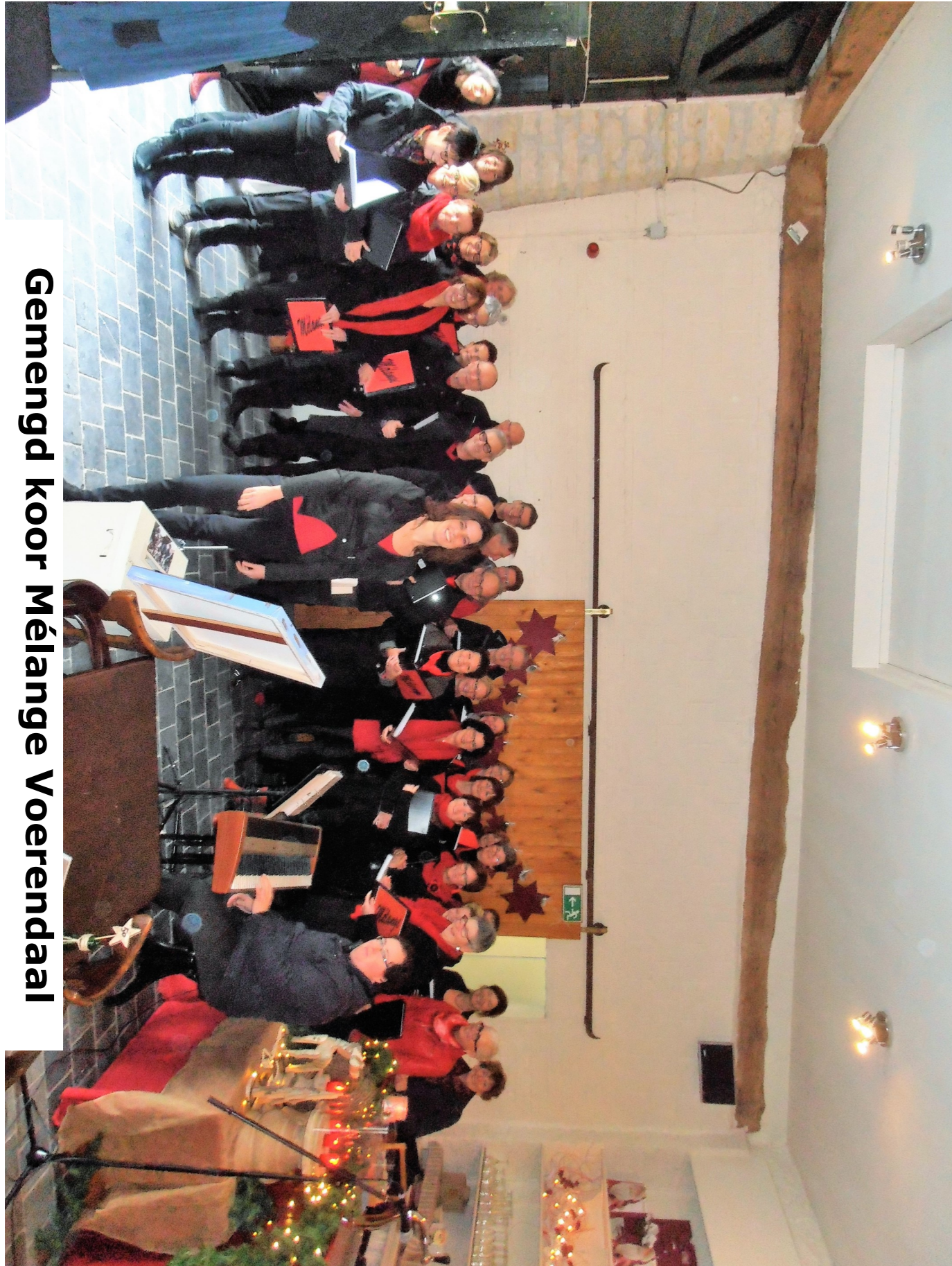
Gemengd koor Mélange Voerendaal